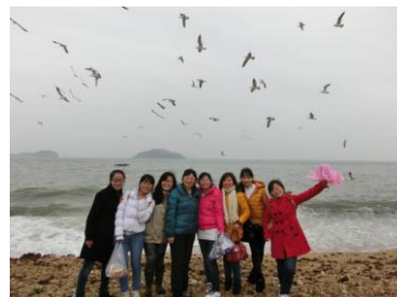
心儿和鸟儿一起飞